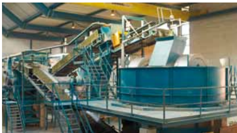
Innovative Ziegelproduktion auf der Basis modernster Technologien

Unsere Produktionsanlagen zählen hierbei zu den modernsten in Europa und schaffen Standards, die Maßstäbe für die Ziegelindustrie setzen. Beispielhaft hierfür ist unter anderem die technologisch ausgereifte Produktion für unser Premium-Produkt UNIPOR CORISO – ein Ziegel, der schon heute die Anforderungen für zukunfts-sicheres Bauen erfüllt.