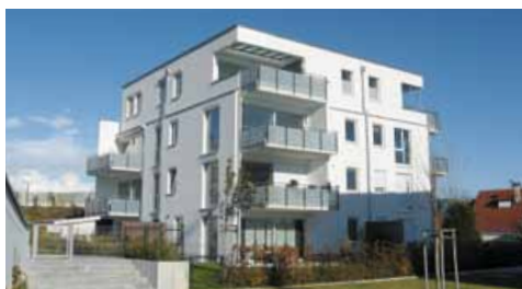
Beratungs- und Produktkompetenz für den Mehrgeschoss-Wohnungsbau und private Bauherren