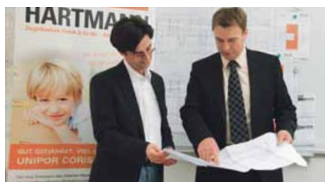
Kompetente Beratung rund ums Bauen