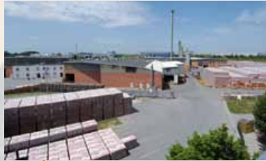
1999 Kauf des Ziegelwerkes Gersthofen mit Ziegelfertigteil- Produktion