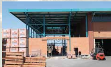
2010 Umzug der UNIPOR CORISO Produktion ins Ziegelwerk Dachau-Pellheim für eine effektive Steigerung der Produktion