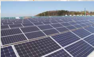
2010 Investition in eine Photovoltaikanlage auf ca. 15.000 m 2 Dachfläche der Produktionshallen.