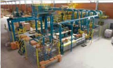
2007 Produktenerweiterung ins Premiumsegment mit der UNIPOR CORISO Technologie. Start der neuen Produktionsanlage im Ziegelwerk Gersthofen.

Neubau einer Längssumpfanlage in der Aufbereitung von Werk 1