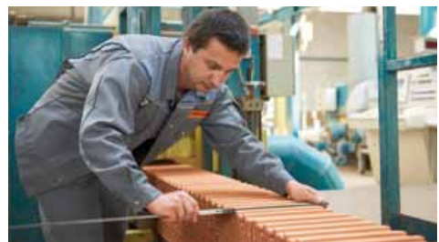
Qualitätskontrolle bis ins Detail

Gemeinsam mit Architekten, Bauunternehmern, Bauträgern und -herren entstehen bleibende Werte über Jahre hinweg.