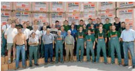
... und des Werks Dachau.

Mit unserem unternehmerischen Auftrag verbinden wir auch ein hohes Maß an Verantwortung: