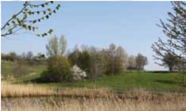
2000-2010 Fortwährende Gestaltung von Renaturierungsflächen als klares Bekenntnis zum Schutz und Erhalt von Natur und Umwelt.