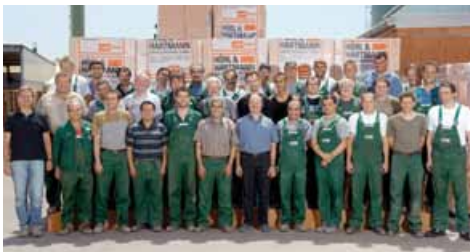
Verantwortungsvolles Miteinander: Ein Teil unserer Belegschaft des Werks Gersthofen...

Unser Ansatz ist es, nicht nur Lebensraum zu schaffen, sondern Lebensraum auch zu erhalten – in vielerlei Hinsicht.