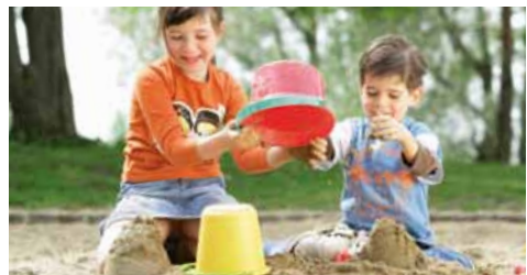
Die Zukunft vor Augen: Nachhaltiges Wirtschaften zum Schutz der Welt von morgen.