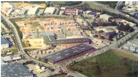
Hörl & Hartmann am Standort Gersthofen

Seit vier Generationen steht der Name Hörl & Hartmann für konsequenten Werterhalt und gelebte Partnerschaft. Mehr als jährlich 1.500 realisierte Bauvorhaben in unseren Vertriebsgebieten Südbayern, Baden-Württemberg, Tirol und Südtirol liefern hierfür den sichtbaren Beweis.