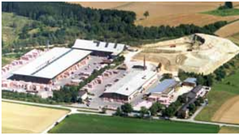
Hörl & Hartmann am Standort Dachau

Als mittelständisches Unternehmen haben wir eine hohe Verbundenheit zu unserer Region und deren Traditionen.