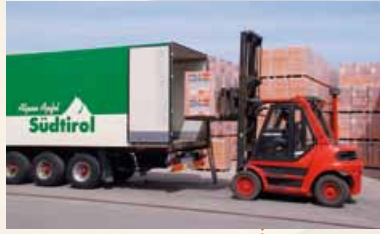
1997/1998 Ausbau der Vertriebsaktivitäten nach Südtirol und Norditalien